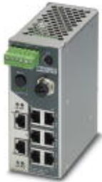
Switch Smart Managed Narrow NAT com oito portas RJ45 de 10/100 MBit/s e função roteador NAT 1:1

Note que os dados aqui indicados foram obtidos do catálogo online. Para informações e dados completos, consulte a documentação do usuário. Aplicam-se as Condições Gerais de Utilização para downloads da Internet. ( http://phoenixcontact.pt/download )