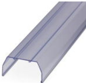
Perfil de cobertura, 36 mm de comprimento, com furo de fixação

Note que os dados aqui indicados foram obtidos do catálogo online. Para informações e dados completos, consulte a documentação do usuário. Aplicam-se as Condições Gerais de Utilização para downloads da Internet. ( http://phoenixcontact.pt/download )