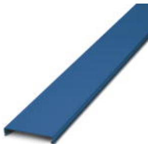
Tampa para canaleta, azul, largura: 100 mm, comprimento: 2.000 mm

Note que os dados aqui indicados foram obtidos do catálogo online. Para informações e dados completos, consulte a documentação do usuário. Aplicam-se as Condições Gerais de Utilização para downloads da Internet. ( http://phoenixcontact.pt/download )