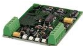
Módulo I/O universal como placa de encaixe

Note que os dados aqui indicados foram obtidos do catálogo online. Para informações e dados completos, consulte a documentação do usuário. Aplicam-se as Condições Gerais de Utilização para downloads da Internet. ( http://phoenixcontact.pt/download )