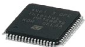
Chip de protocolo escravo INTERBUS

Note que os dados aqui indicados foram obtidos do catálogo online. Para informações e dados completos, consulte a documentação do usuário. Aplicam-se as Condições Gerais de Utilização para downloads da Internet. ( http://phoenixcontact.pt/download )