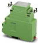
Ponto de blindagem de reposição, para terminal bus INTERBUS-ST BKM-...

Conexão blindada - IBS RB-SHIELD - 2722742