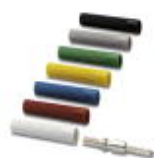
Suporte isolante, Cor: branco