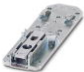
Adaptador para trilho de fixação universal

Adaptador para montagem - UTA 107/30 - 2320089